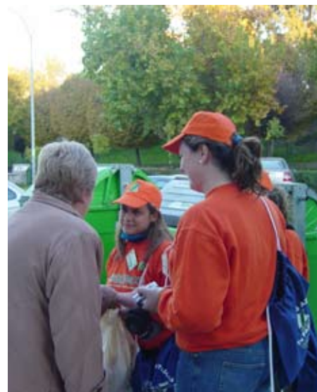
Agentes de Sadeco reparten información junto a los contenedores de reciclaje

Eliminación de plagas y desratización especial en la zona, por parte de un equipo de desinfección.